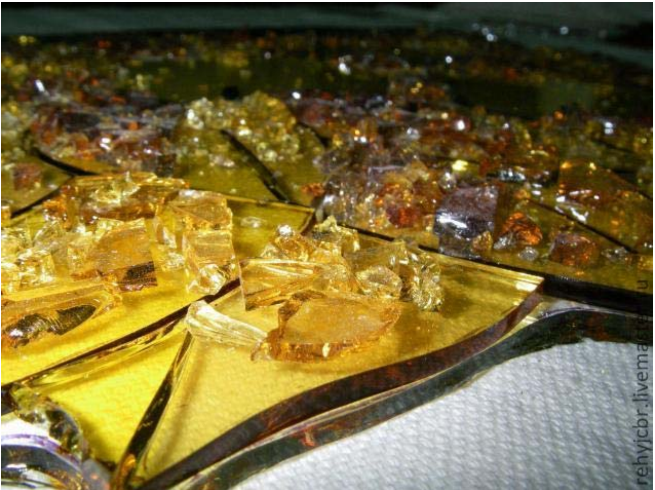
Фритта - стеклянная крошка.